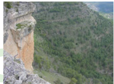
Cuenca será la primera provincia castellano-manchega con certificación forestal

Indudablemente. Es importante para la comercialización de sus productos. Probablemente quien no se haya incorporado a este proceso tendrá dificultades. La existencia o no de madera o producto certificado será una importante barrera comercial. En un mundo global se buscan diferencias que garanticen la calidad de un producto. El sello es una seña de identidad y una garantía, en nuestro caso, de hacer bien nuestro trabajo.