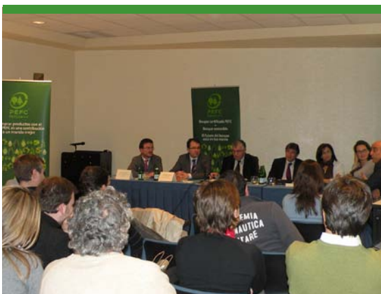
Jornada técnica celebrada en Sevilla

En las jornadas técnicas de sensibilización se analizó la importancia de incorporar la eco-innovación en las empresas del sector forestal, los métodos de implantación de la certificación forestal y la cadena de custodia, el impacto de la nueva legislación ambiental, la compra pública verde y las políticas de responsabilidad social corporativa. Se realizaron un total de 7 ediciones en distintas ciudades y en ellas participaron 265 destinatarios.